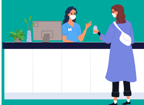
TABLA DE BENEFICIOS BIENESTAR 2025